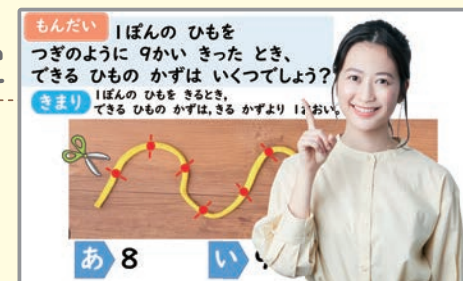
オンラインライブ授業 特別講師 梶 愛海

※実施日・視聴方法などは「チャレンジウェブ」内の「オンラインライブ授業」お知らせページをご確認ください。※パソコン、タブレット、スマートフォンからご覧になる場合は、「進研ゼミ 小学講座」の会員番号とパスワードが必要です。※パスワードについては、4月号または入会時にお届けしている「宛名用紙」をご覧ください。